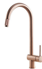
VOLTA COPPER 8491 108