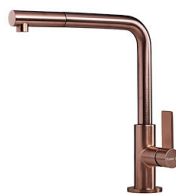
VELA PLUS COPPER satiniert 8498 128