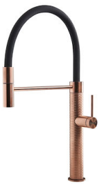
Mischbatterie Skin Copper 8424 858